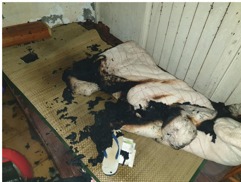
圖一：起火處(菸蒂丟棄處)