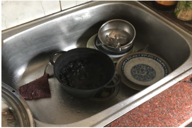
照片 2: 鍋具煮焦位置