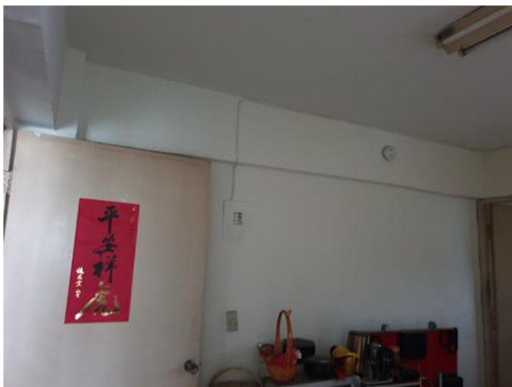
圖三：住警器安裝位置(客廳)