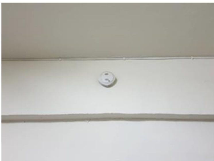
圖二：住警器動作情形