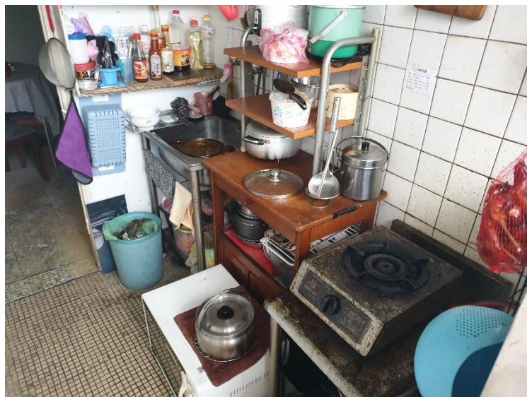
圖一：起火處(煮焦的鍋子)