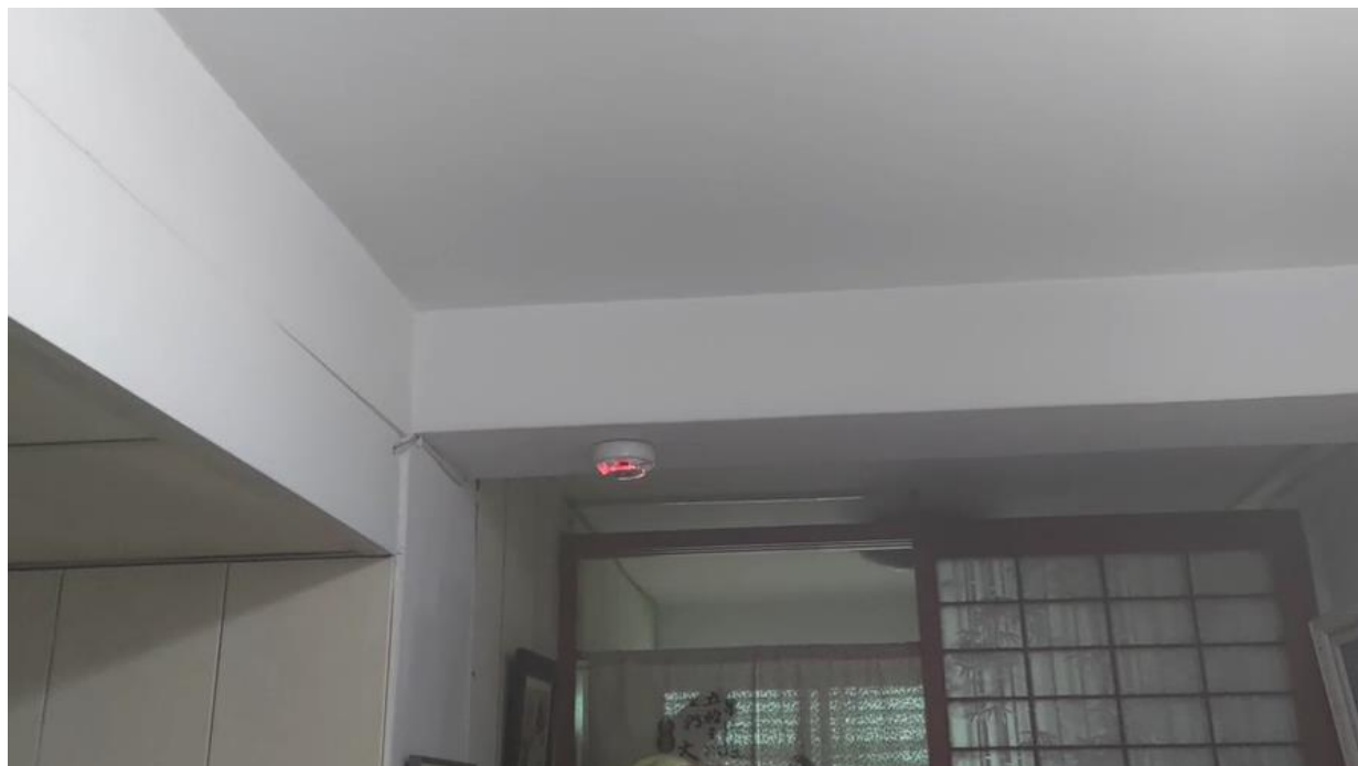
圖二：住警器安裝位置(客廳上方樑柱)