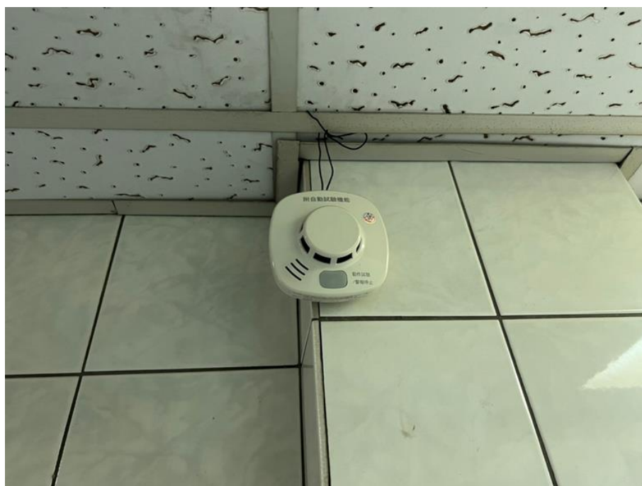
圖二：住警器動作情形