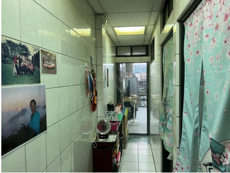
圖三：住警器安裝位置(走廊)