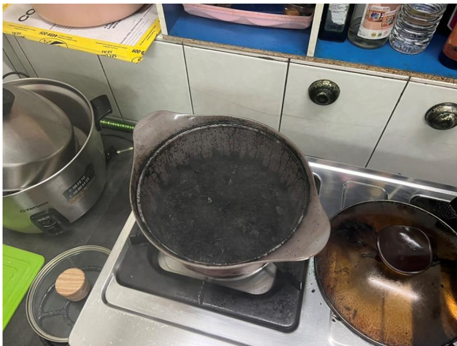
圖一：起火處(煮焦的鍋子)