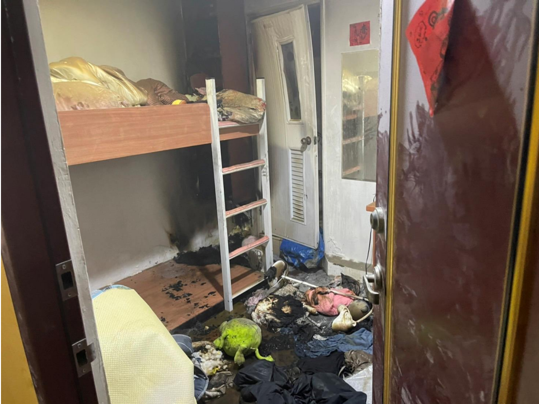
圖一：現場燃燒情形