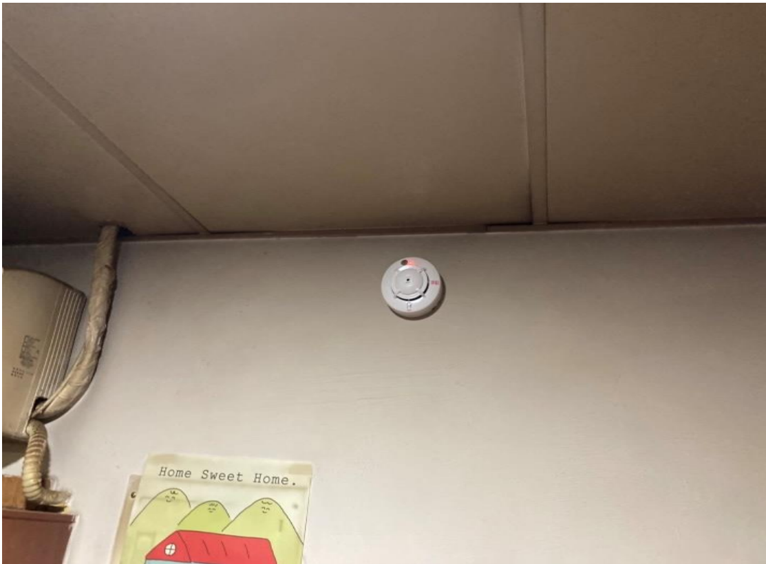
圖二：住警器裝設位置