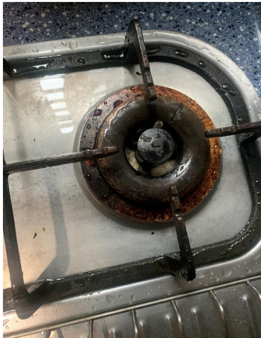
圖二：廚房起火點特寫