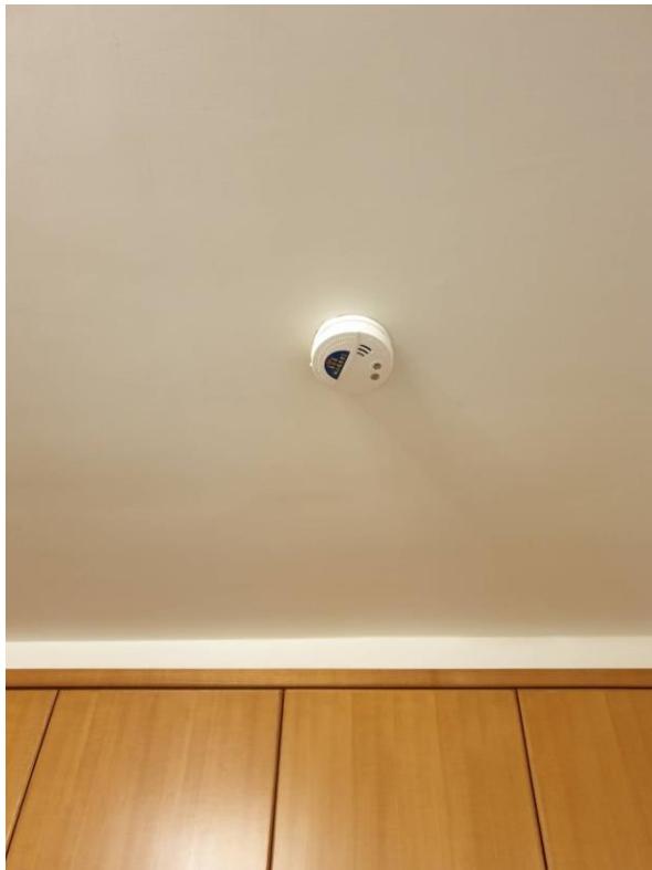
圖三:住警器安裝位置<客廳>