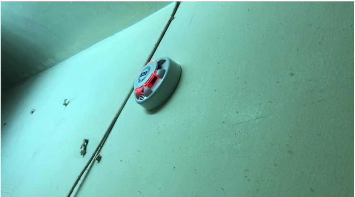
圖二：住警器裝設位置(走道牆面)