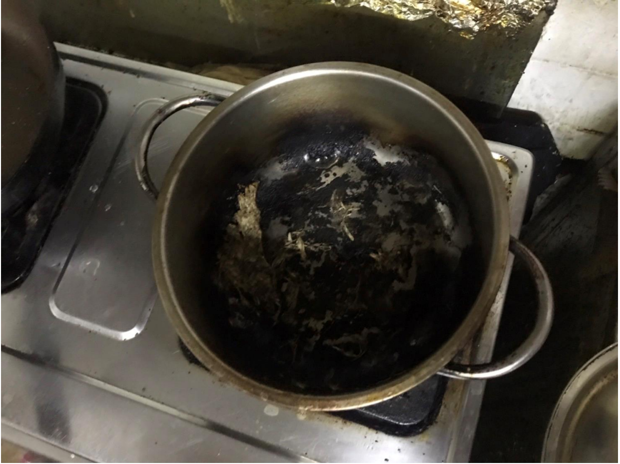
圖一：現場燃燒情形