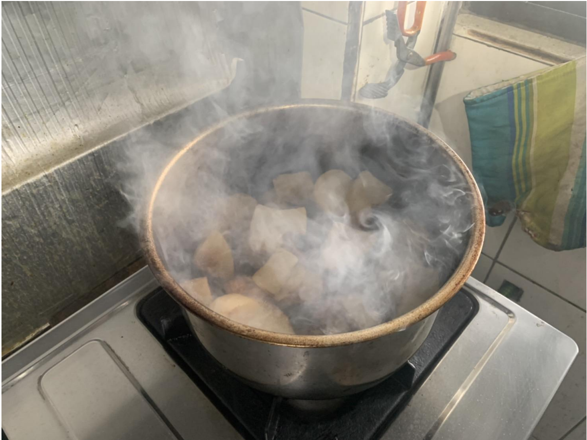
圖一：現場燃燒情形