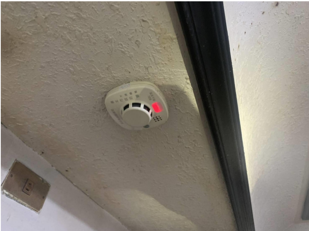
圖二：住警器裝設位置