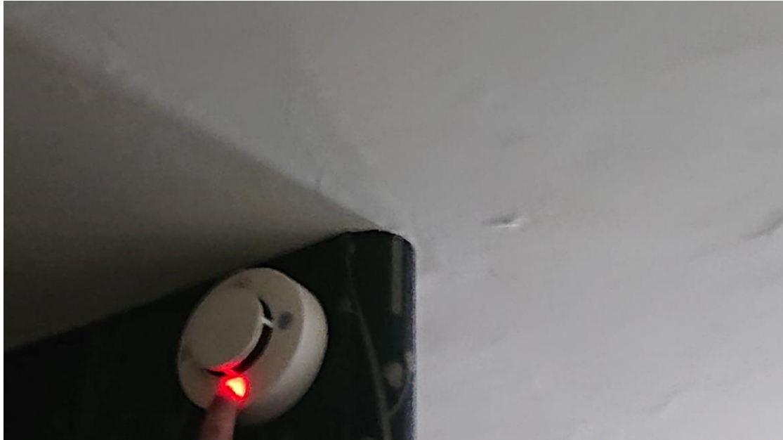
圖 2：住警器動作情形