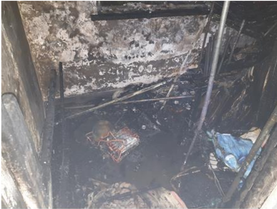
起火點照片(除濕機)