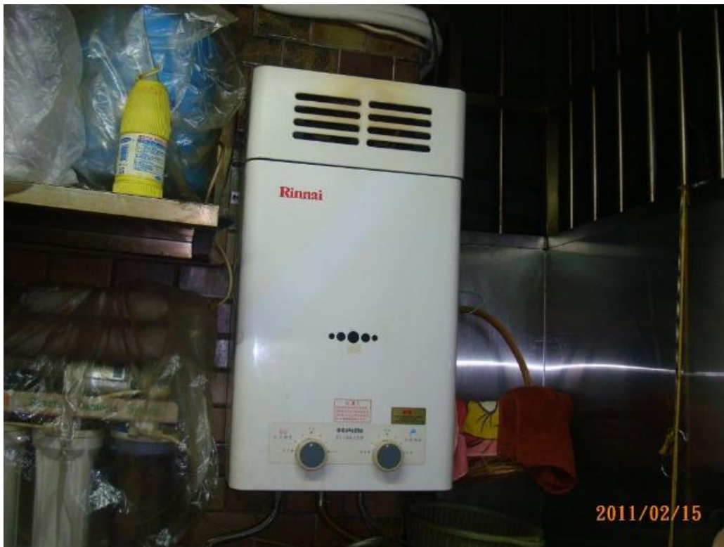
RF 式熱水器裝設於屋內範例圖