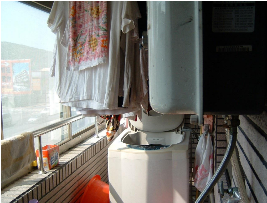
RF 式熱水器裝設於加蓋陽臺範例圖