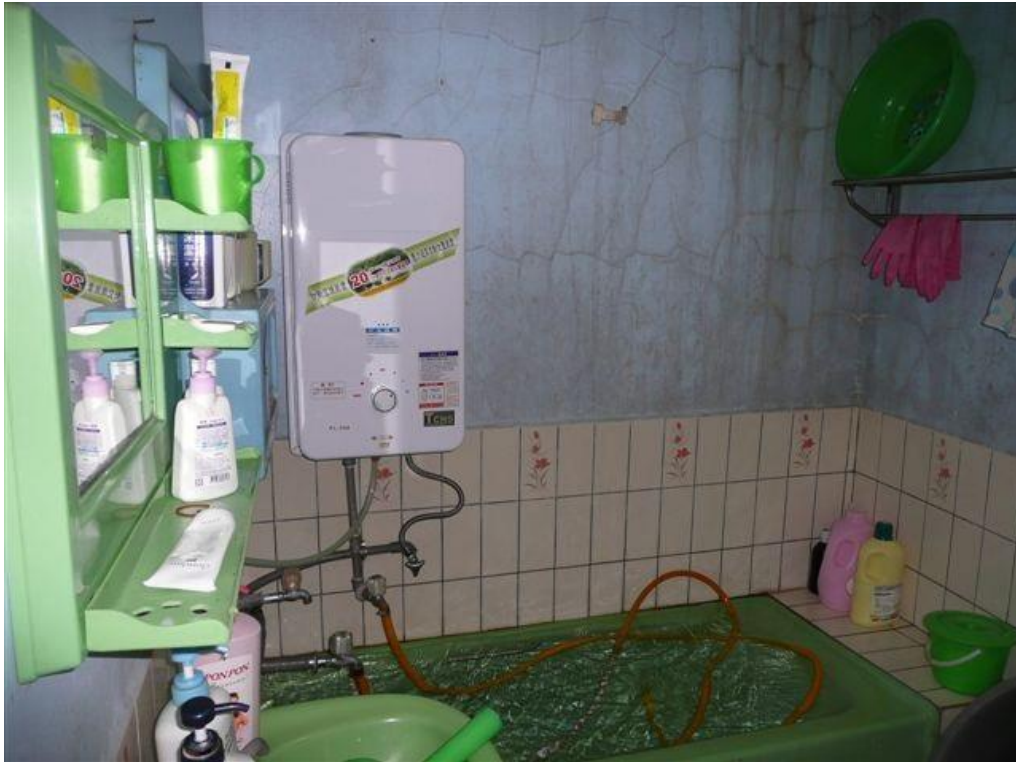
CF 式熱水器未裝設排氣管範例圖