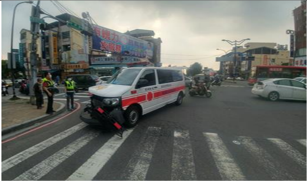
圖 1: 事故車輛現場狀況。