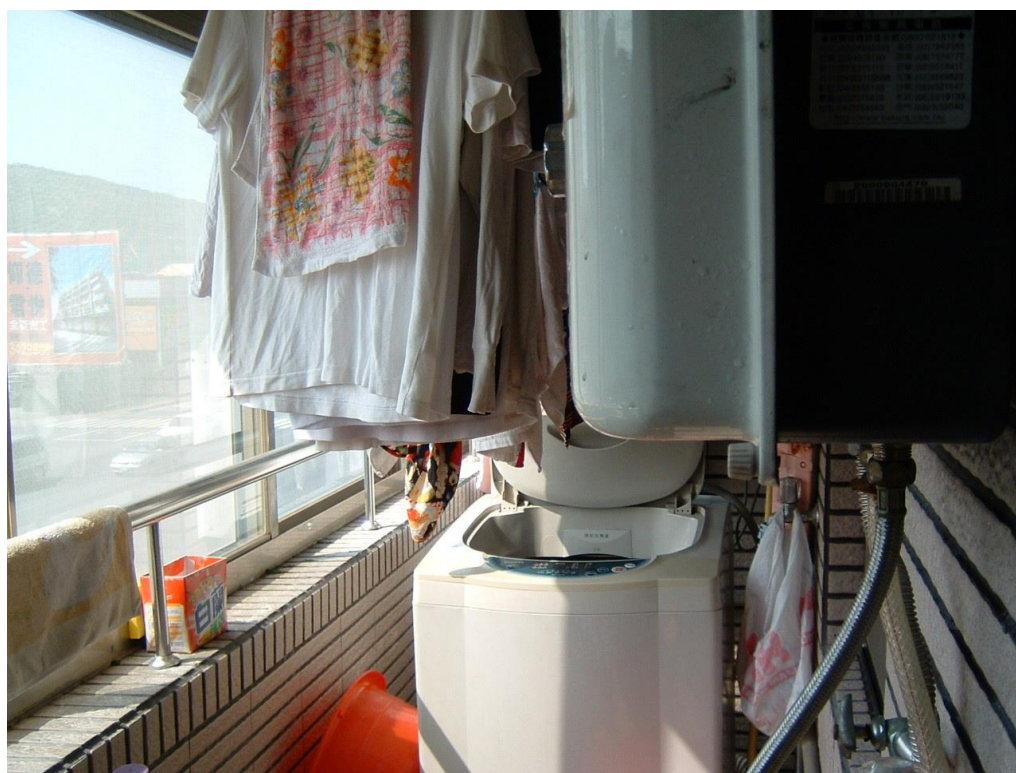
RF 式熱水器裝設於加蓋陽台範例圖