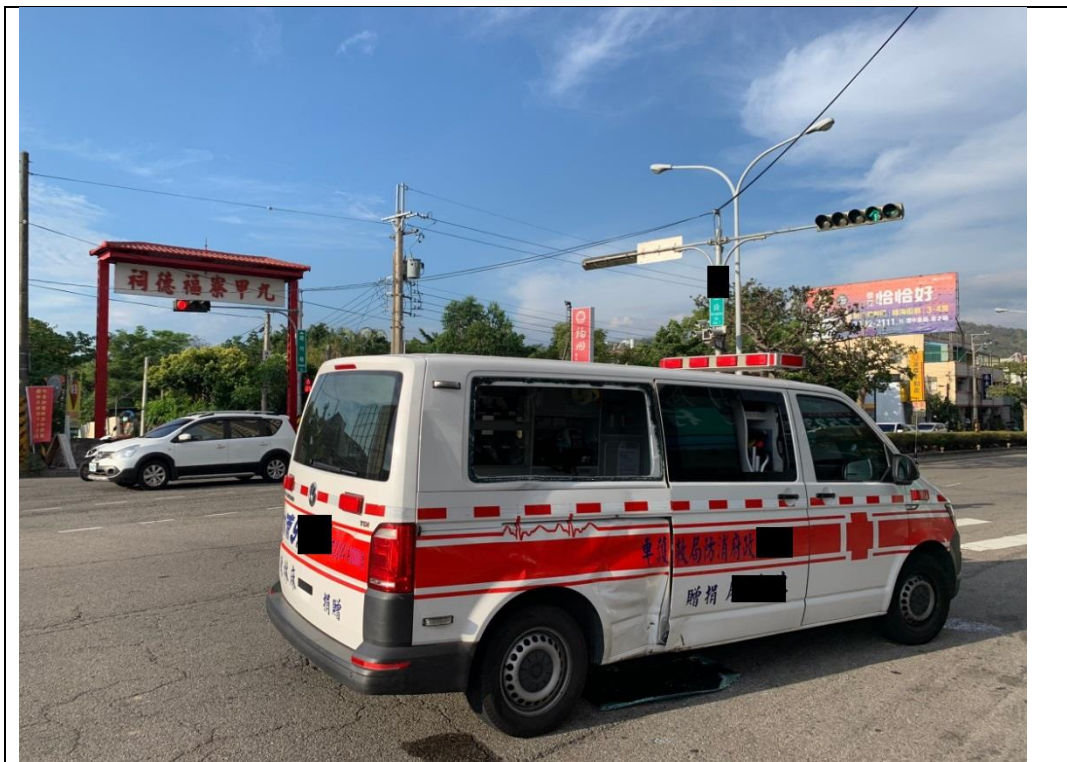
說明：救護車右側損壞照片