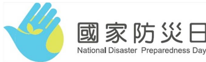
圖 1、國家防災日 LOGO (名稱：青鳥)

國家防災日 LOGO 係去(108)年辦理「921 震災 20 週年暨莫拉克風災 10 週年」系列活動時，由行政院(以下簡稱本院)與教育部合作，向國內設計相關學院或對設計有興趣之在校學生徵件，徵選結果由特優獎「青鳥」作為往後國家防災日 LOGO (詳圖 1)。請各機關(單位)於辦理國家防災日相關活動時，將此 LOGO 廣為運用於各式活動場布及文宣設計上，以達到形象識別之效果(圖檔可至「中央災害防救會報」網站下載)。