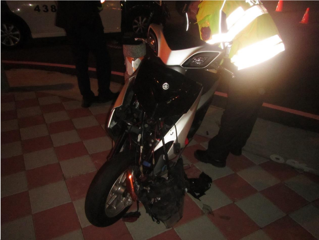
說明：機車車頭毀損